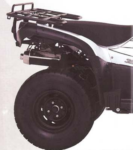
Abb.: Blade 550 4x4 IRS